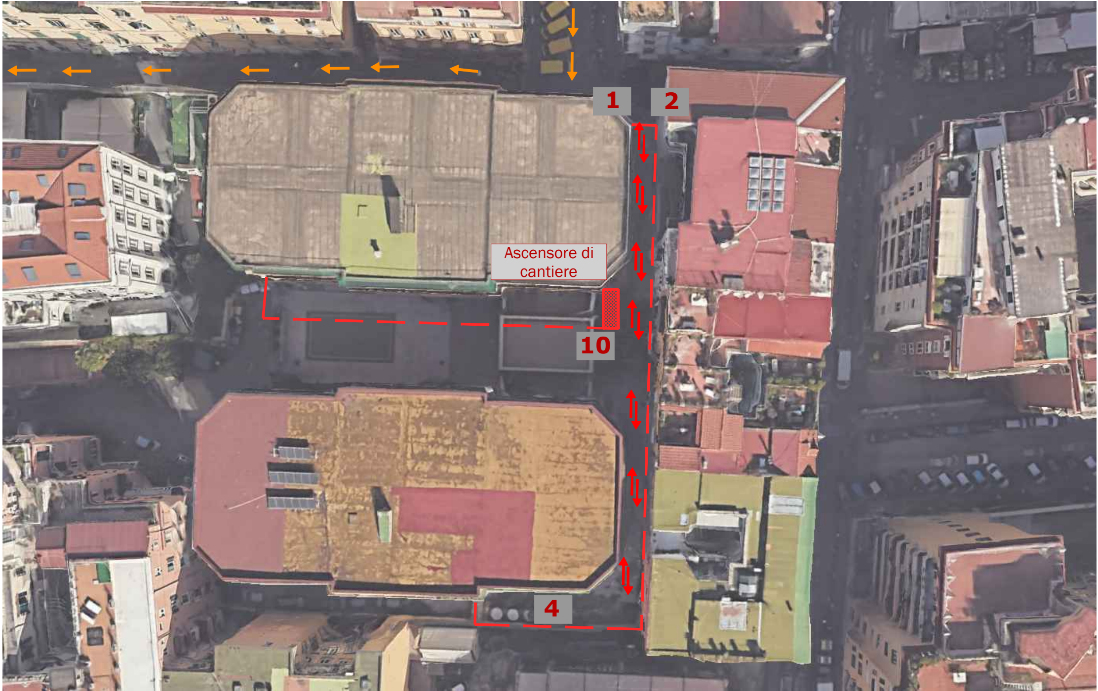
LAYOUT DI CANTIERE SU FOTO AEREA